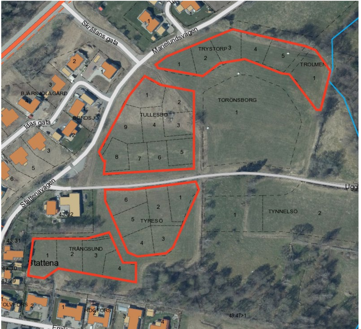
Karta över de 25 tomter som erbjuds till försäljning.